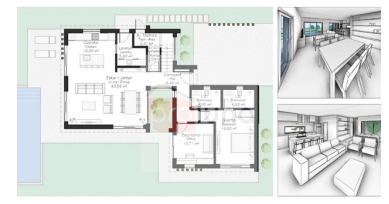
ês do Chão | Ground floor