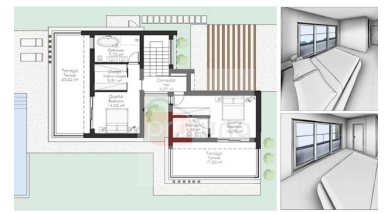
ISO | 1 st floor